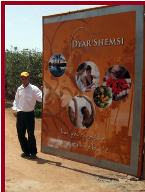
photo : L'entrée de Dyar Shemsi, à 40 kilomètres d'Agadir. © Yann Gallic