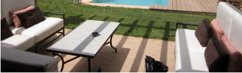
photo : La maison témoin. Celle de Maurice sera à peu près identique.